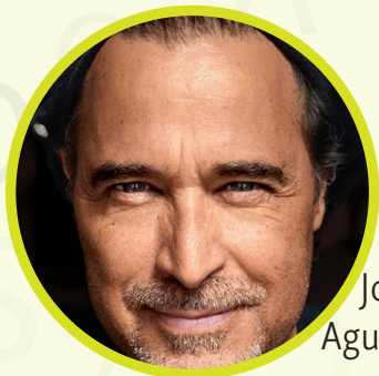
José E. Aigualusa

21h00 Teatro de Variedades do Porto Judeu Auditório do Ramo Grande